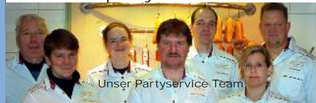
Unser Partyservice Team